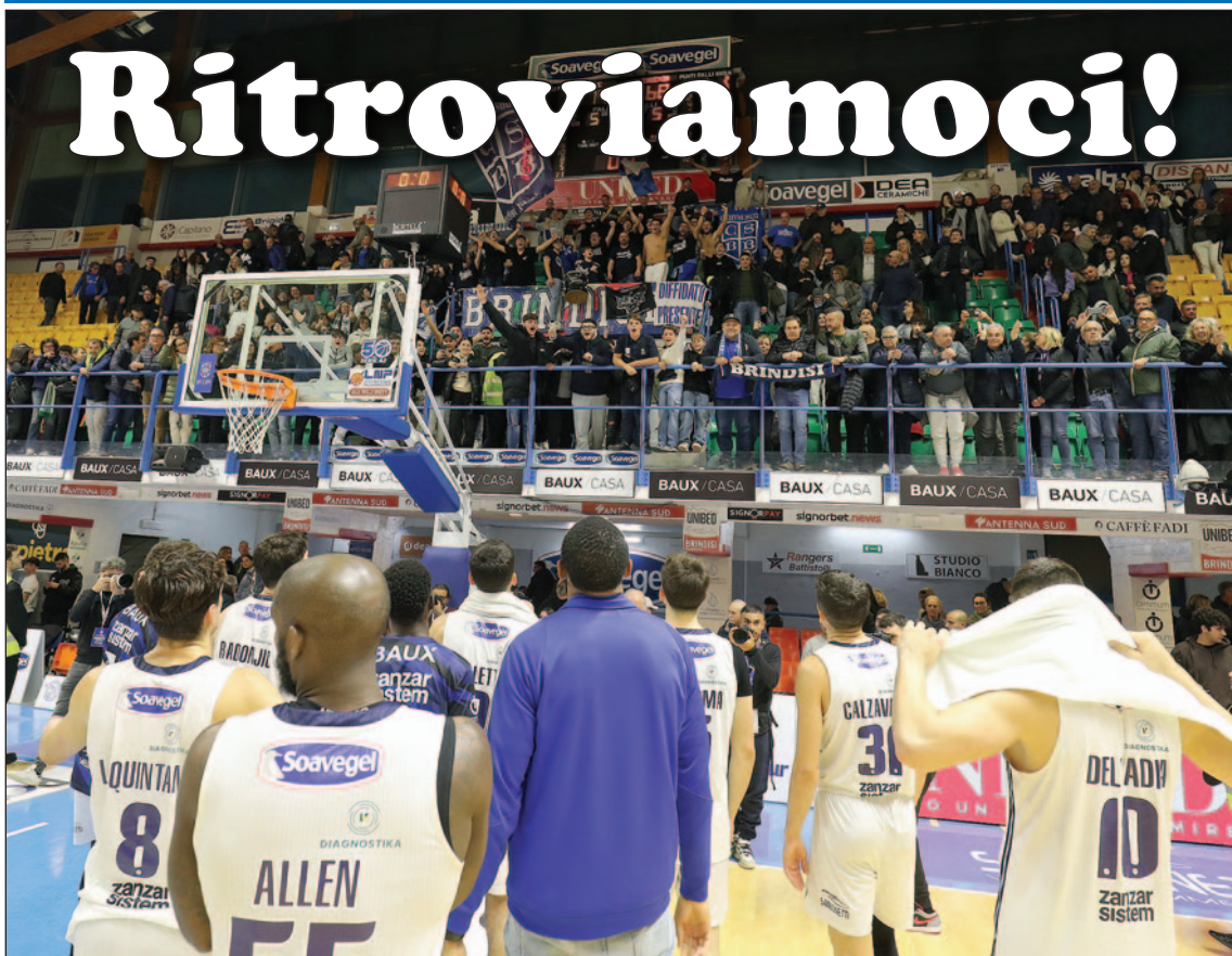
Il festoso abbraccio di fine partita tra squadra e tifosi

LNPPASS: VALTUR-CARPEGNA PROSCIUTTO DOMENICA ALLE 18.00