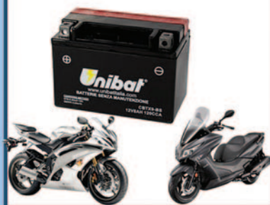
Batterie Moto e Servizi