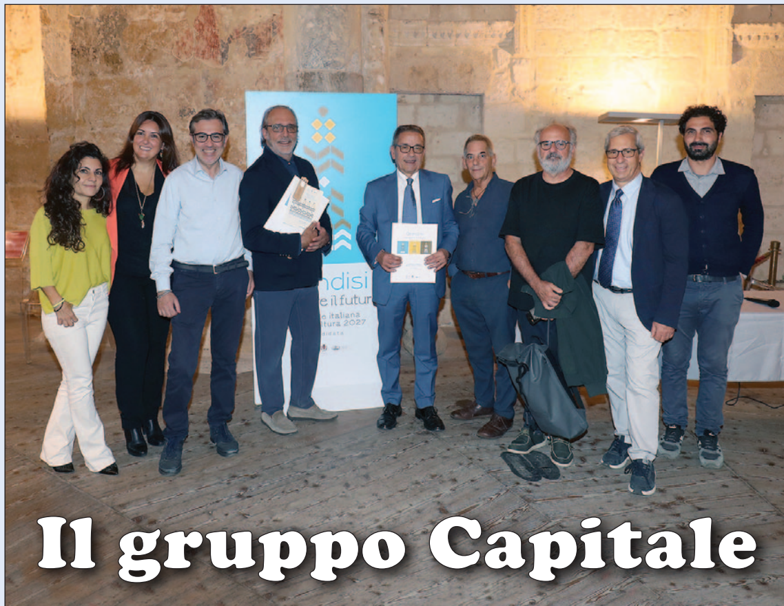
Il gruppo di lavoro con il presidente FTV Luca Ward - Servizio a pagina 3