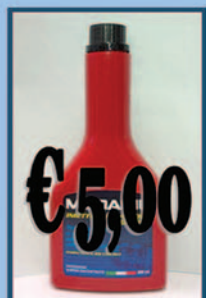
Additivo Diesel Pulizia iniettori

Aloisio Ricambi - Via Appia, 234 - 72100 - Brindisi Tel. 0831/582133 - Sito www.aloisioricambi.it