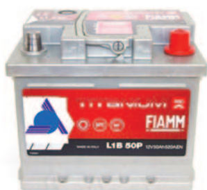
Batterie Auto e Veicoli Commerciali