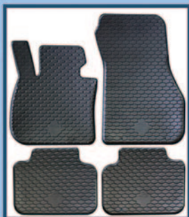
Tappeti in gomma su misura