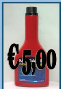
Additivo Diesel Pulizia iniettori

Aloisio Ricambi - Via Appia, 234 - 72100 - Brindisi Tel. 0831/582133 - Sito www.aloisioricambi.it