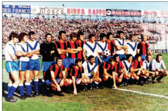
Il derby tra Taranto e Brindisi in Coppa Italia del 30 agosto 1972. Fini 0-0