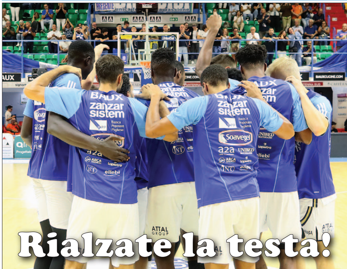
I giocatori dell'Happy Casa Brindisi, prima di una partita

OTTAVA SCONFITTA CONSECUTIVA. DOMENICA ARRIVA LA VIRTUS BOLOGNA