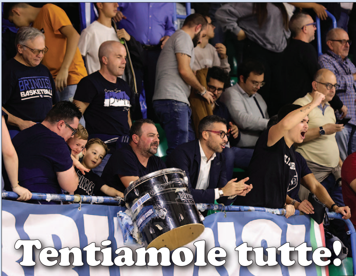
Il giemme della NBB in curva durante Brindisi-Milano