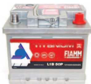
Batterie Auto e Veicoli Commerciali