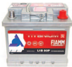
Batterie Auto e Veicoli Commerciali