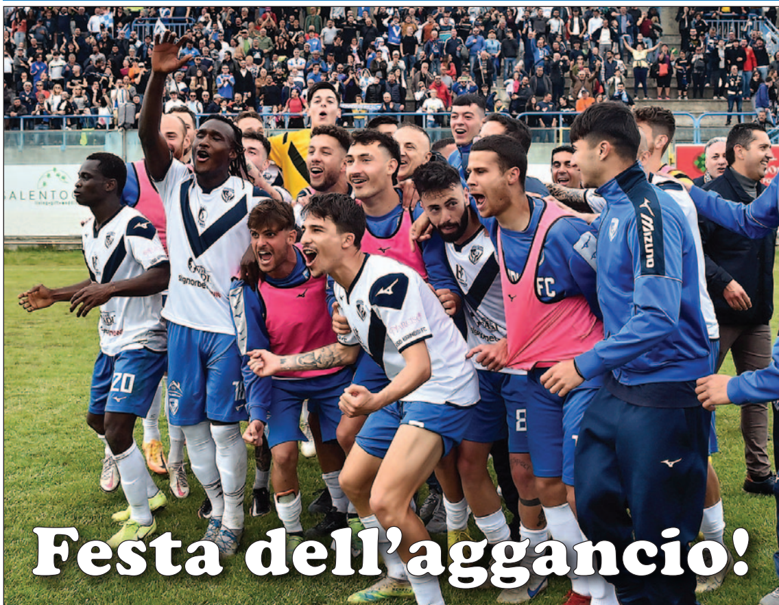
La gioia dei giocatori biancoazzurri