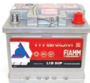
Batterie Auto e Veicoli Commerciali