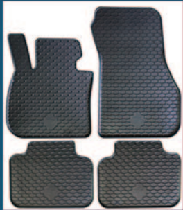
Tappeti in gomma su misura