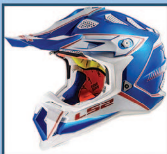
Caschi Modulari Integrali / Cross