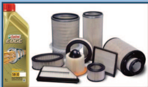
Kit Tagliando Auto