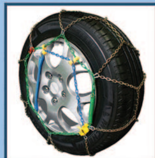
Catene da Neve