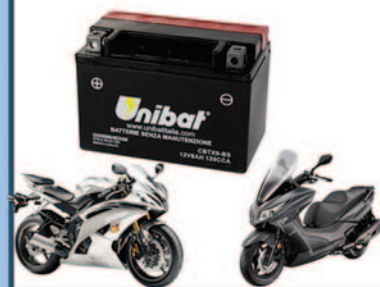
Batterie Moto e Servizi