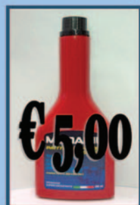
Additivo Diesel Pulizia iniettori

Aloisio Ricambi - Via Appia, 234 - 72100 - Brindisi Tel. 0831/582133 - Sito www.aloisioricambi.it