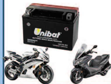
Batterie Moto e Servizi