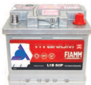
Batterie Auto e Veicoli Commerciali