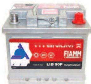
Batterie Auto e Veicoli Commerciali