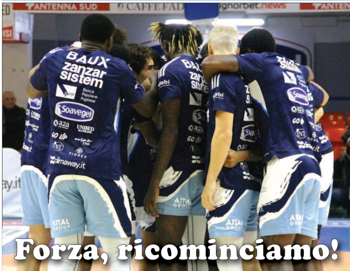
I giocatori dell'Happy Casa Brindisi

L'HAPPY CASA OSPITA LA VUELLE. E MERCOLEDÌ MATCH DI COPPA COL DONAR