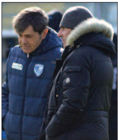
Di Costanzo e Dionisio

Gli adriatici si trovano in una posizione di classifica molto particolare: a sei punti dai playoff e a sei dai play-out. In entrambi i casi non c'è la matematica, né per sentirsi definitivamente tranquilli rispetto al (comunque) remoto coinvolgimento nella zona retrocessione, né per non