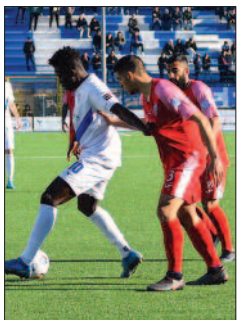
Il derby Fasano-Brindisi

Dopo un filotto di cinque partite vinte il Brindisi, pur giocando bene, perde (1-0) il derby esterno col Fasano. La gara, molto agonistica e poco tecnica, ha visto le due squadre affrontarsi a viso aperto col chiaro intento di incamerare i tre punti. Il goal della vittoria fasanese è stato realizzato, grazie a un penalty da Corvino al 10'. Terzo rigore consecutivo assegnato dagli arbitri contro i messapici, nelle ultime tre partite (uno parato da Cavalli), il totale è sette... nessuno a proprio favore dopo 28 giornate di campionato. Grazie alla vittoria, il Fasano consolida la quarta posizione in zona playoff. Per il Brindisi la sconfitta, anche se mal digerita in quanto subita in un derby molto sentito dalle tifoserie, non cambia il programma societario, più volte dichiarato, di salvezza. Nonostante la devastante falsa partenza (un solo punto in 9 gare), l'attuale rosa a disposizione del bravo tecnico Di Costanzo, ha tutte le carte in regola per riuscire nell'impresa. I biancoazzurri, con 30 punti in classifica, sono posizionati ai margini dei play out, in compagnia del San Giorgio e della Mariglianese. In questa particolare classifica, escludendo il Matino con