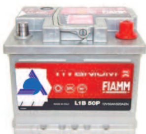
Batterie Auto e Veicoli Commerciali