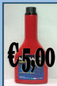
Additivo Diesel Pulizia iniettori

Aloisio Ricambi - Via Appia, 234 - 72100 - Brindisi Tel. 0831/582133 - Sito www.aloisioricambi.it