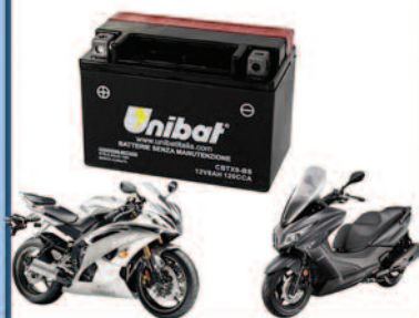
Batterie Moto e Servizi