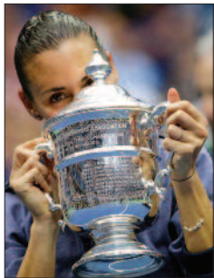
La nostra Flavia Pennetta col trofeo degli US Open del 2015.

3) 4 giugno 1972: promozione della Brindisi Sport in serie B. Il pa-