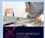
LICEO MUSICALE Renzo Marzolla