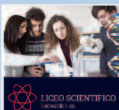
LICEO SCIENTIFICO Renzo Marzolla

Per una formazione di qualità, per la vita ... la Scuola a misura di studente