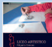
LICEO ARTISTICO Renzo Marzolla