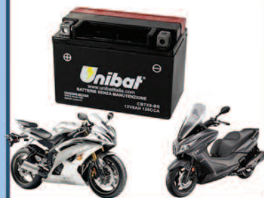
Batterie Moto e Servizi