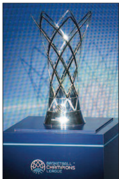
Il trofeo della BCL