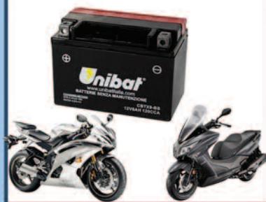
Batterie Moto e Servizi