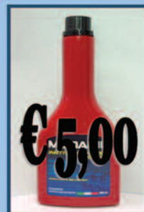
Additivo Diesel Pulizia iniettori

Aloisio Ricambi - Via Appia, 234 - 72100 - Brindisi Tel. 0831/582133 - Sito www.aloisioricambi.it