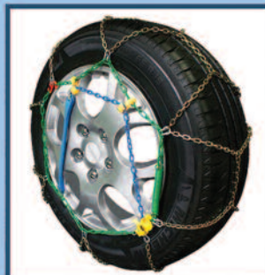
Catene da Neve