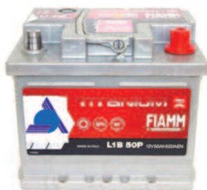
Batterie Auto e Veicoli Commerciali