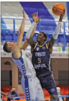
Brindisi-Burgos