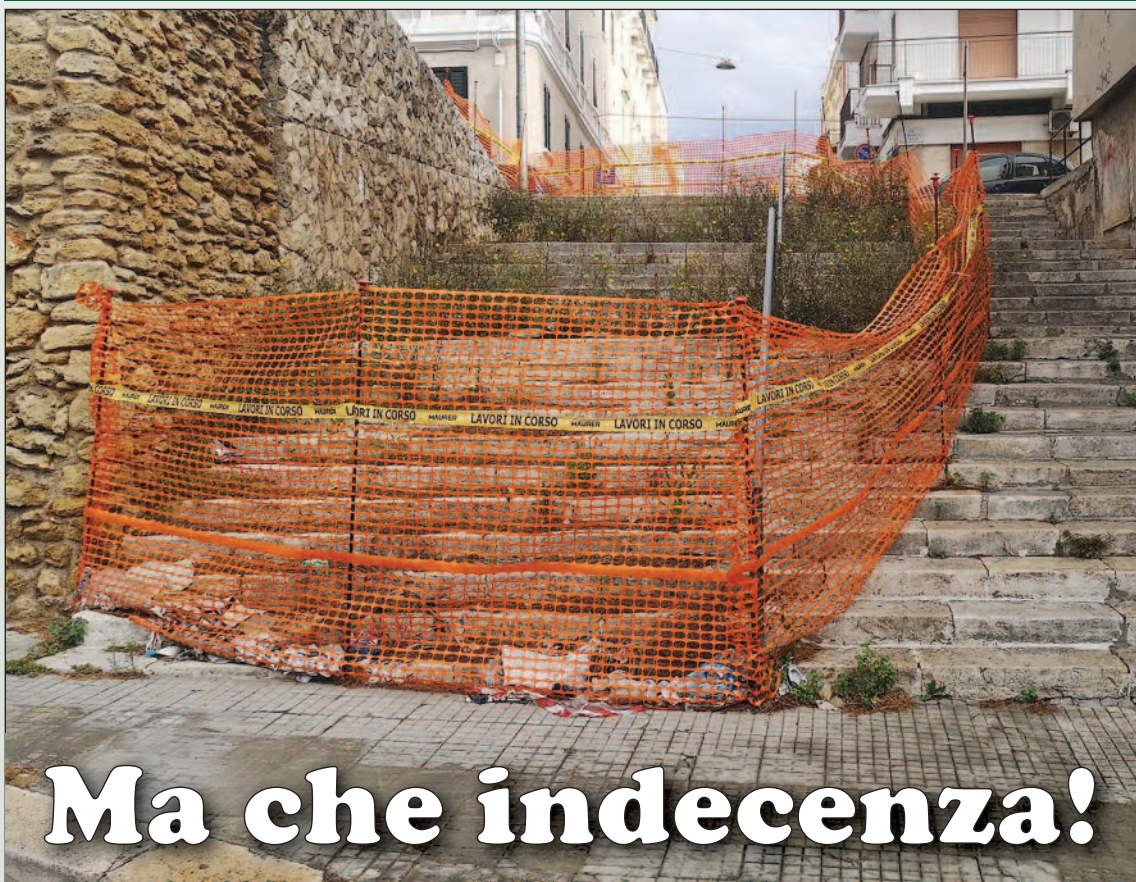
La scalinata tra via Federico II e via Nazario Sauro