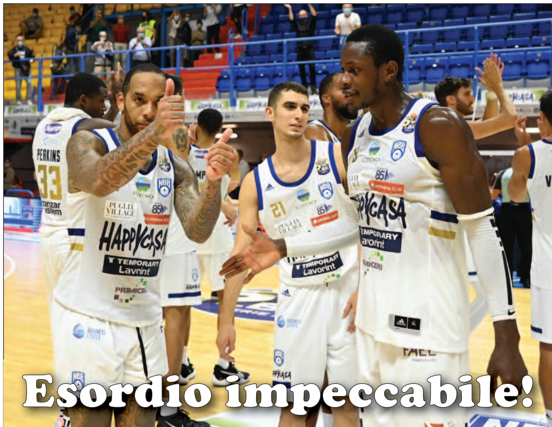
La festa biancoazzurra nel Pala Pentassuglia a fine partita

NELLA PRIMA INTERNA BRINDISI SURCLASSA ROMA: HARRISON TOP SCORER