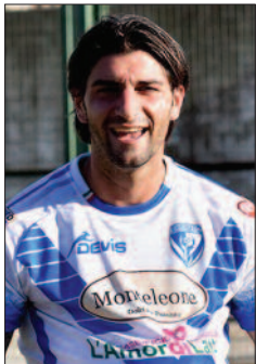
Palazzo