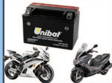
Batterie Moto e Servizi