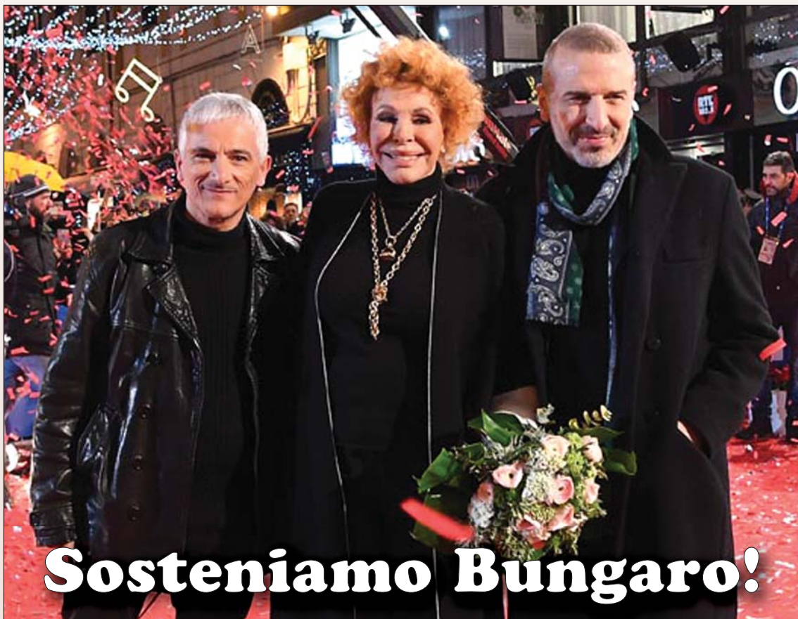
Bungaro con Ornella Vanoni e Pacifico a Sanremo

IL CANTAUTORE BRINDISINO IN GARA A SANREMO CON VANONI E PACIFICO