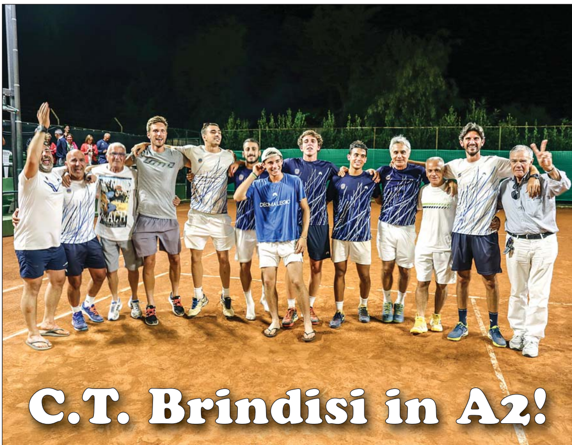
Fotoricordo della festa per la promozione in serie A/2 maschile.

ESALTANTE SUCCESSO CON BENEVENTO DOPO UNA SFIDA DURATA 14 ORE