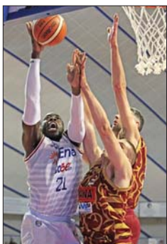
Anosike nel Talierecino

Lo stop di una settimana per la F8 di Coppa Italia fa male all'Enel Brindisi. Trasferita amara per i biancoazzurri di coach Bucchi che nel PalaTalierecino perdono nettamente con una Reyer Venezia sicuramente più motivata. Il risultato finale (97-75) non la dice tutta sull'andamento della gara. È già, perché Zerini e compagni, hanno retto per circa tre quarti: poi,