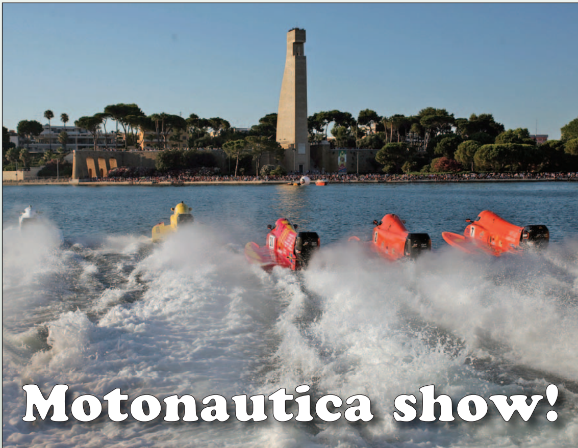
La spettacolare partenza del campionato disputato nel 2013

4-5-6 LUGLIO: A BRINDISI LA SECONDA EDIZIONE DEL CAMPIONATO MONDIALE