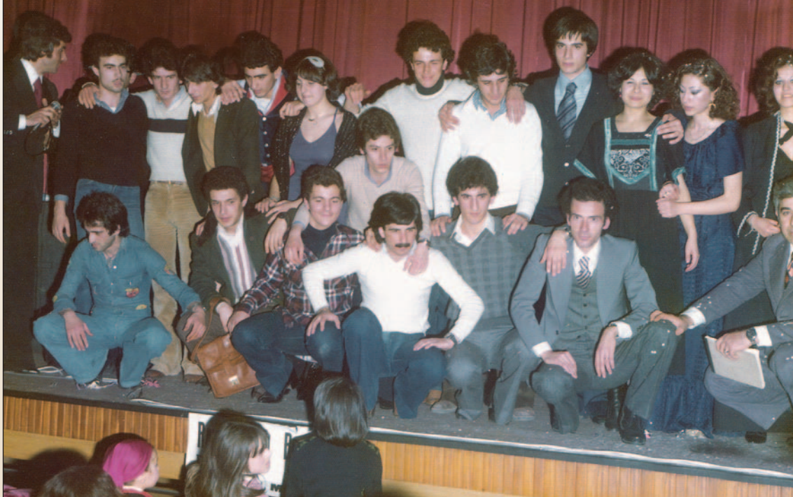
Un evento carnevalesco di RVB nel Cinema Teatro Astra negli anni Settanta (nota a pagina 5).

BASKET: DISCONTINUITA' - CALCIO: SCALATA ESALTANTE