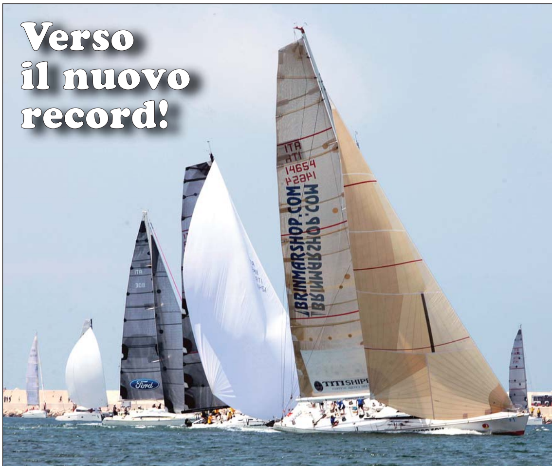
Un momento della partenza della scorsa edizione