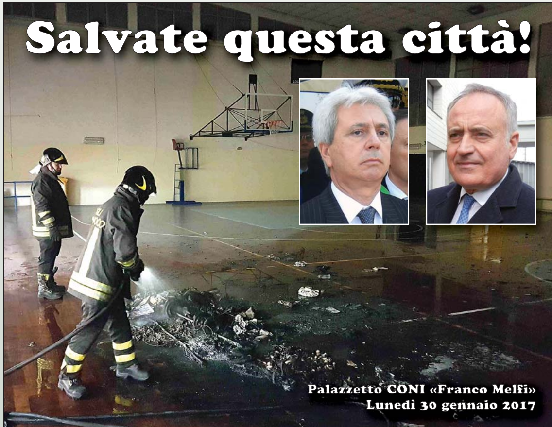
Palazzetto CONI «Franco Melfi» Lunedì 30 gennaio 2017