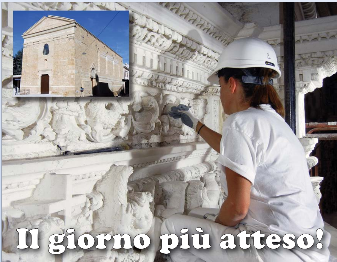
Un momento del complesso lavoro di restauro della chiesa di San Paolo eremita

RESTAURO COMPLETATO: DOMENICA 28 OTTOBRE RIAPRE SAN PAOLO