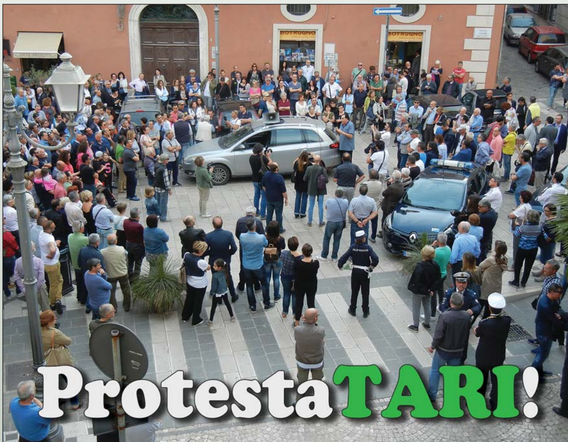
Mercoledì 24 maggio 2017: la manifestazione di protesta dei cittadini in piazza Matteotti