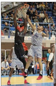
Enel Brindisi-Le Mans Sarthe