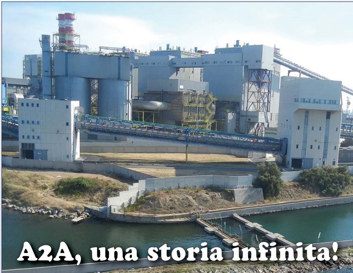
Servizio di Giorgio Sciarra in Zona Franca a pagina 3