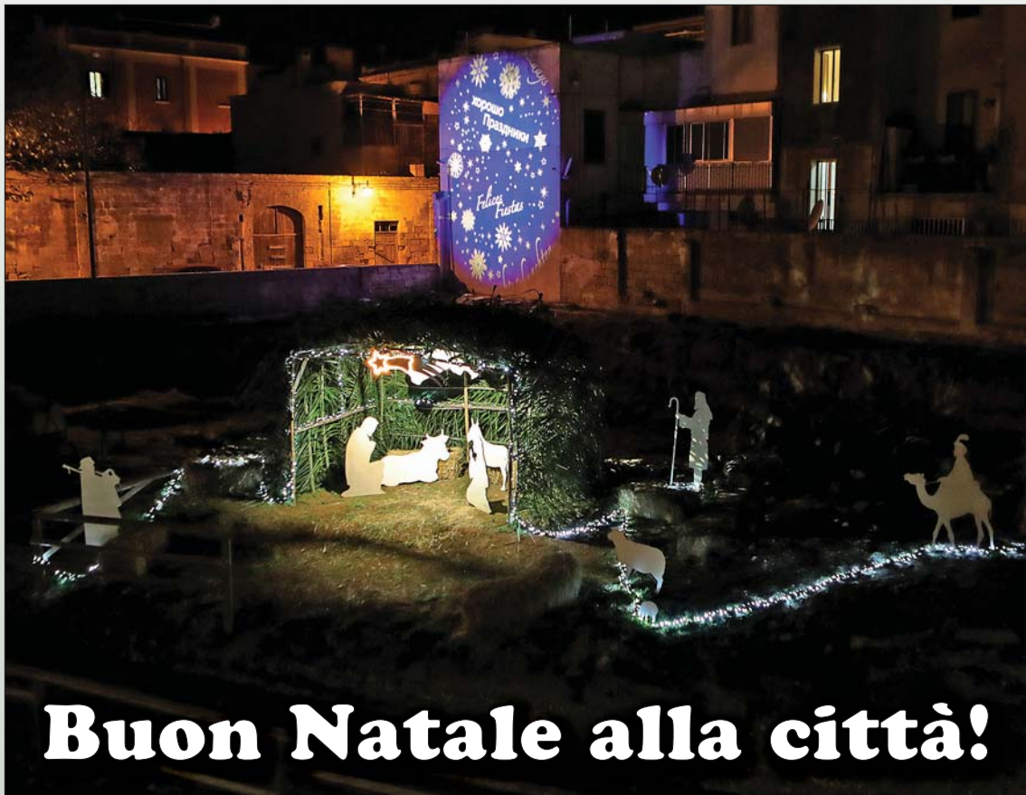
Il presepe di Via del Mare