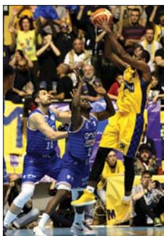
Manital Torino-Enel Brindisi

Domenica a Torino si è vista una squadra confusa, sottotono, mai entrata in partita. Pugliesi e piemontesi sono scesi in campo con obiettivi differenti. La formazione di coach Bucchi, «salva» dopo la bella vittoria su Milano, poteva solo sperare in un posto per i playoff. Troppo importante la posta in palio per i gialloblù di Frank Vitucci che si giocavano una buona fetta della permanenza in Lega A. La Manital ha disputato una partita perfetta, o quasi, e come spesso accade, l'ex di turno è stato l'attore principale. È il caso di