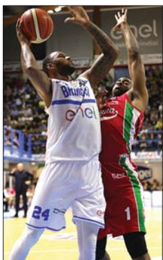
Enel Basket Brindisi-EA7 Milano