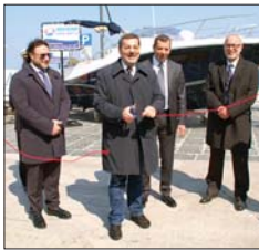
Il rituale taglio del nastro