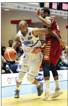
Enel Brindisi-Reyer Venezia

Brescia, Brindisi, Pistoia, Caserta e Torino: cinque squadre con sette vittorie al termine del girone di andata, ma fortunatamente la classifica avulsa ha premiato la squadra di Meo Sacchetti. Nell'anticipo di sabato sera con l'Umana Venezia, Cardillo e compagni hanno disputato una buona gara contro un roster di prima fascia. Pur priva di tre giocatori importanti come Peric, Tonut e Filloy (quest'ultimo a referto solo per onor di firma), la compagine lagunare ha confermato di essere la seconda forza del campionato, almeno per il momento. E' stata una sfida equilibrata nei primi due quarti, con i biancoazzurri che hanno avuto subito in Carter il protagonista: il rookie di Thomasville ha alternato buone giocate sotto canestro a soluzioni offensive dalla media. Buona la prova di Phil Goss, che da ex di turno ha