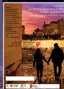
Locandina Notte Nazionale del Liceo Classico