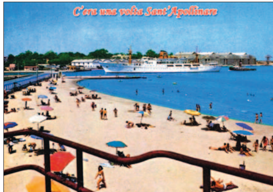
C'era una volta Sant'Apollinare

vano a tamburello. Non mancava la concitata gara sull'albero della cuccagna, precedentemente unto con tanto grasso. La mellonata si concludeva, in tarda serata, con la festa danzante che si svolgeva sulla grande terrazza del bar-ristorante «La Rotonda». Il rientro a casa avveniva spesso su una barca i cui remi, tagliando le onde, creavano suggestive forme «fosforescenti». Questa la meravigliosa, dorata spiaggia brindisina che, nella seconda metà degli anni '50, dovette arrendersi ad un discutibile processo di industrializzazione che distrusse la sua incomparabile bellezza. Un'altra pagina strappata dall'antologia della storia di una Brindisi che non c'è più.