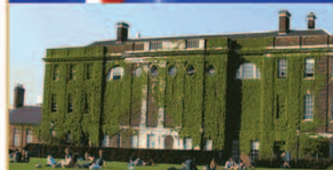
Sede delle attività: Goldsmiths College University of London